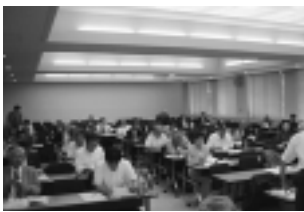
9月6日(日) 社会奉仕委員長会議