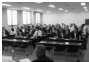
9月13日(日) 職業奉仕委員長会議